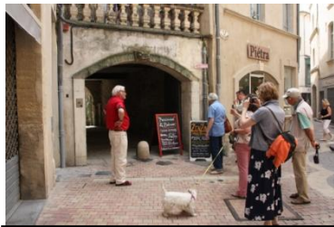
Un passage entre deux rues