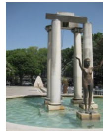
La Place d'Assas