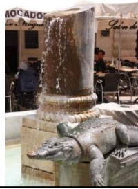
La Fontaine et son crocodile : l'emblème de Nîmes